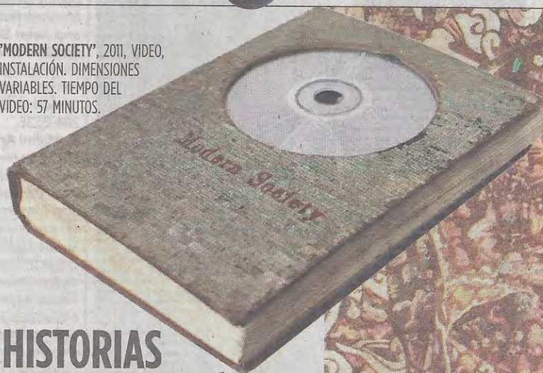
'MODERN SOCIETY', 2011, VIDEO, INSTALACIÓN. DIMENSIONES VARIABLES. TIEMPO DEL VIDEO: 57 MINUTOS.