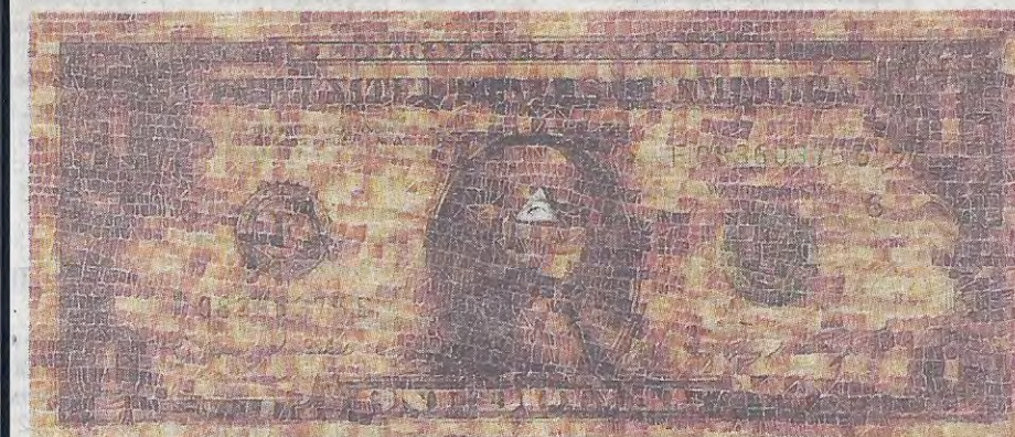
'IN GOD WE TRUST', 2011, FRAGMENTOS DE ALAS DE CUCARACHAS SOBRE UN BILLETE DE UN DÓLAR, 2,6 X 6,1 PULGADAS.