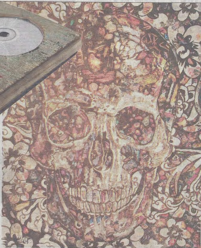
'SOMETHING ABOUT FASHION', 2011, 'COLLAGE', MOSCAS APLASTADAS SOBRE LIENZO, 72 X 60 PULGADAS.