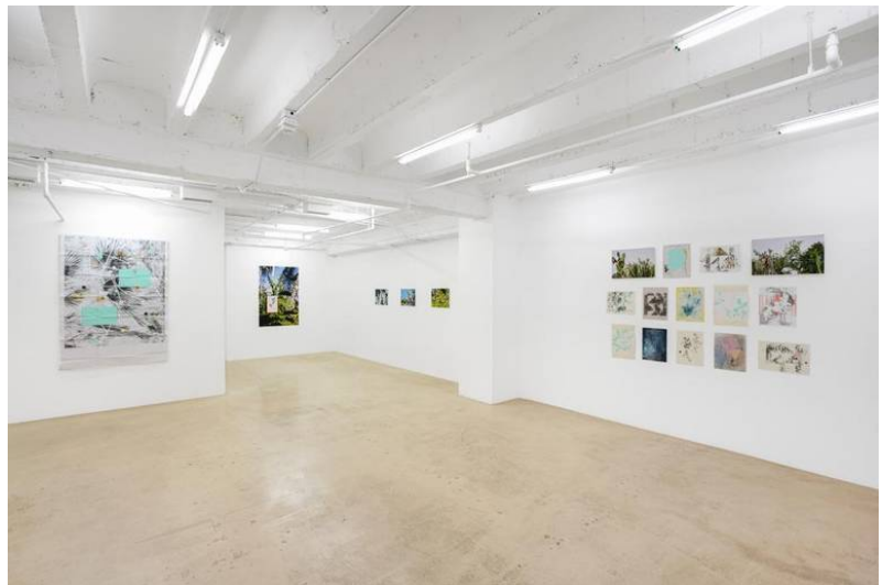
Vista general de la exhibición de Adler Guerrier en David Castillo Gallery. Christian Hernandez David Castillo Gallery