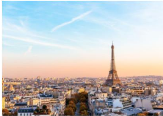
Un restaurant et deux expositions.

Le mois de mai est désormais amorcé. Ce week-end, la journée de samedi sera nuageuse, mais le soleil sera bien présent dimanche. Avec précaution, nous vous proposons une sélection en intérieur avec un restaurant et deux expositions.