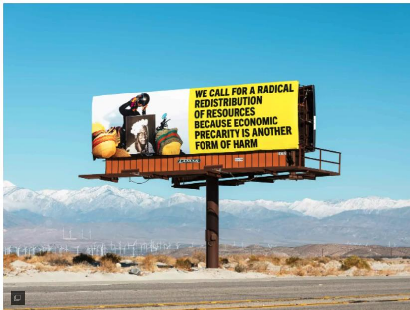
Installation de la série "Because You Know Ultimately We Will Band A Militia", 2021.

La sélection de la rédaction des expositions pour faire le pont sans manquer de rebond.