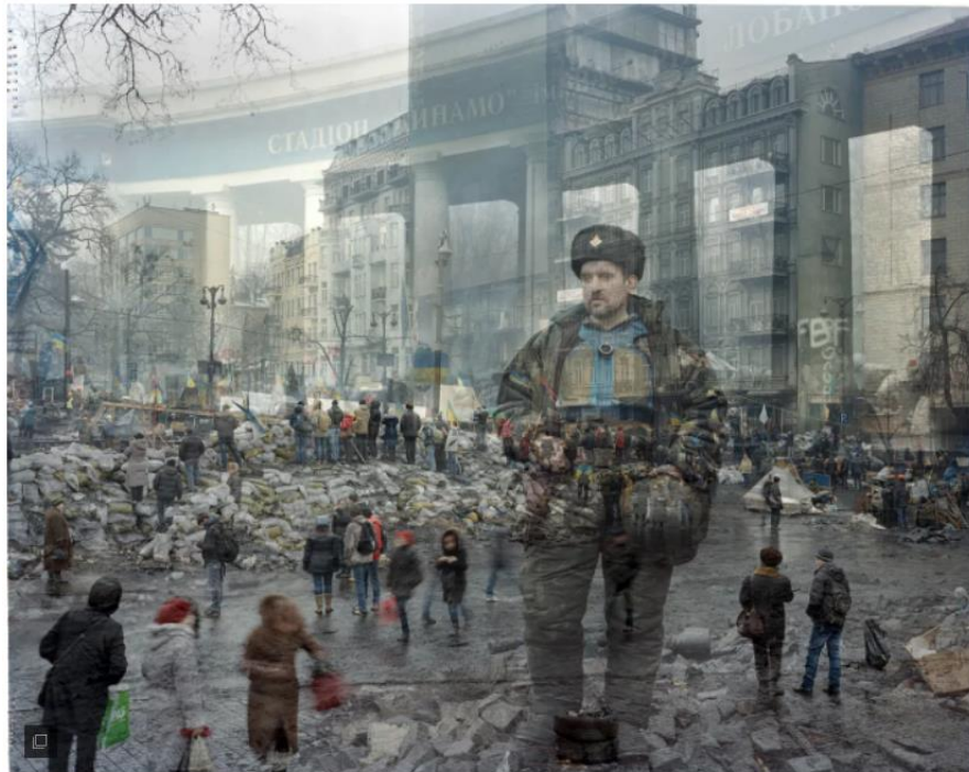
"Le peuple de Maidan", février 2014.