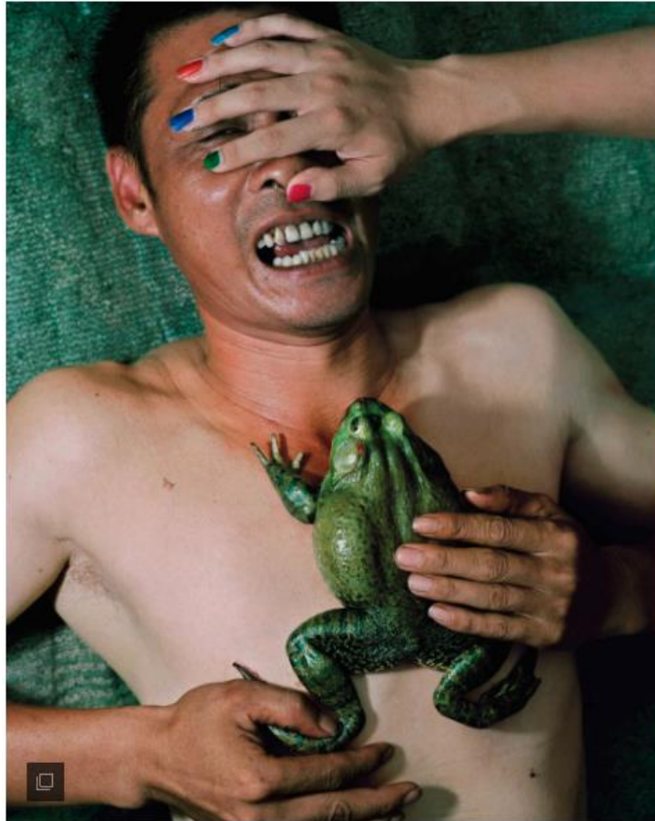
"Gentle Kiss", 2019. © Zhang Zhidong.