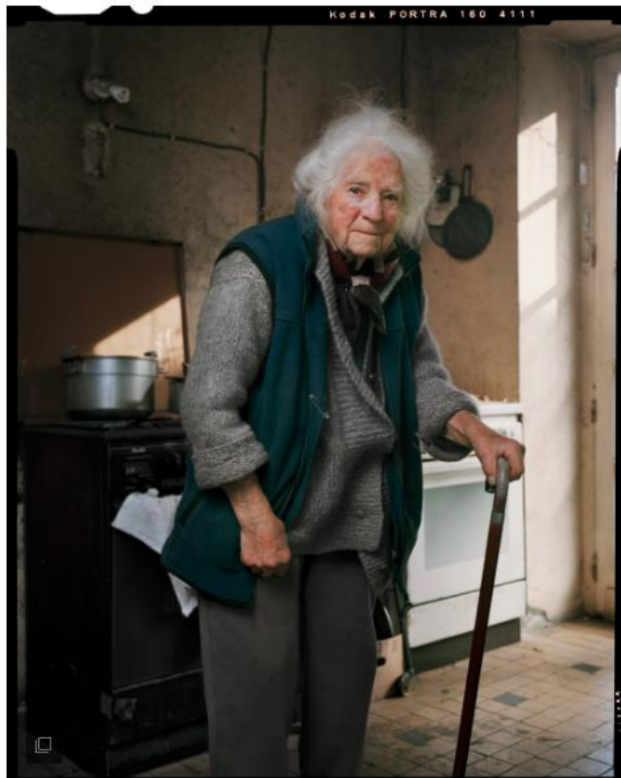
De la série "Paysannes".